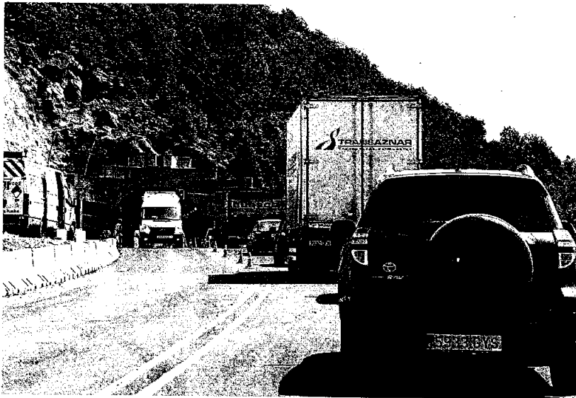
Durante la mañana se produjeron algunas retenciones puntuales, a la espera de hacer efectivo el desvío. F. P.

De esta forma, la nueva calzada será bidireccional, con un carril por sentido, durante el tiempo que dure el acondicionamiento del túnel de la N-330. A este respecto, el jefe provincial de Tráfico, Andrés Fernández del Río, comentó que de momento el Ministerio de Fomento no les ha comunicado el plazo aproximado de ejecución de estas obras. No obstante,