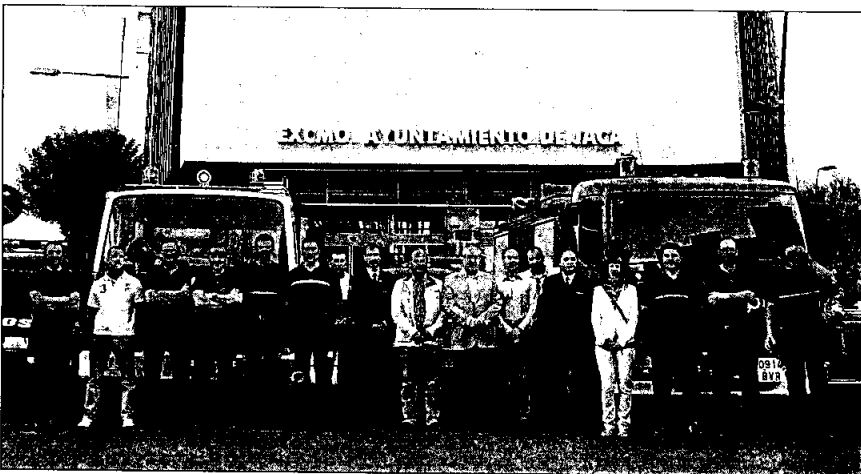
Personal y responsables políticos del servicio posan junto al parque móvil de emergencias

El Servicio de Emergencias del Ayuntamiento de Jaca realizó en 2011 un total de 228 intervenciones, de las que 48 fueron actuaciones en incendios y 44 en la red de agua. Son 14 menos que en 2010, año en el que se contabilizaron 242 salidas.