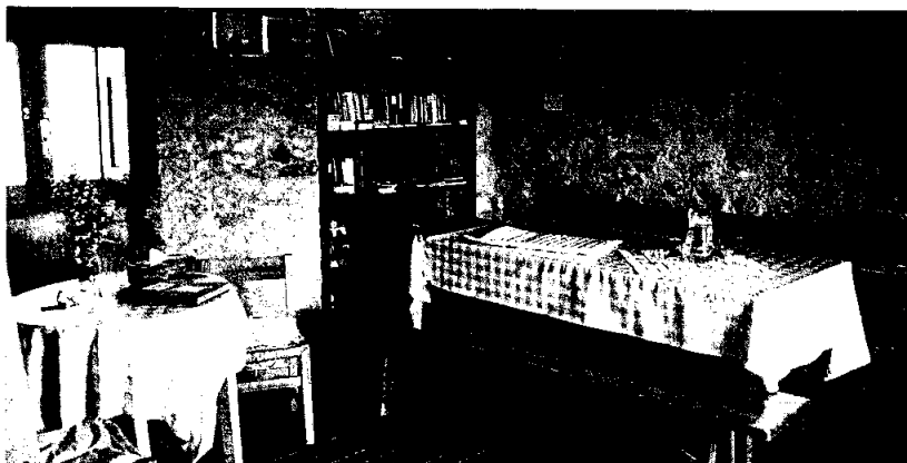
Comedor y el cuarto de estar del albergue. R.G.

bierta ayer, y contó con la implicación de la asociación jacobea "American Pilgrims of the Camino", de Estados Unidos.