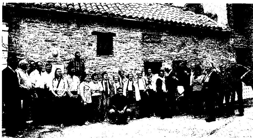
Autoridades de Bailo y Arrés, representantes de la Federación y vecinos, en la inauguración de las obras de mejora.

El patrocinio de la remodelación del albergue de Arrés corrió a cargo de la Federación, como recordó una placa descu-